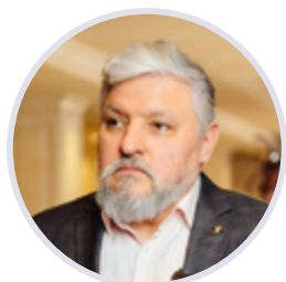
Игорь Бухаров Президент Федерации Рестораторов и Отельеров России