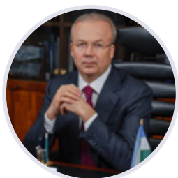
Андрей Назаров Премьер-министр Республики Башкортостан