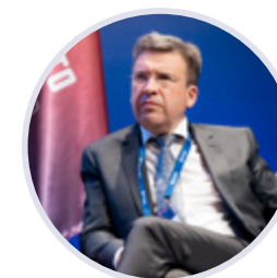
Владлен Максимов Президент Ассоциации малоформатной торговли России