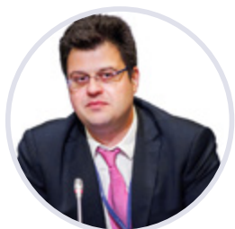
Никита Кузнецов Директор Департамента развития внутренней торговли Минпромторга России