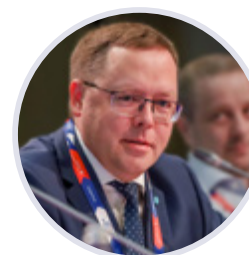
Андрей Карпов Председатель правления Российской Ассоциации экспертов рынка ритейла